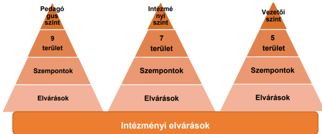
3. sz. ábra. A standard elvárásainak és az intézményi elvárások viszonya