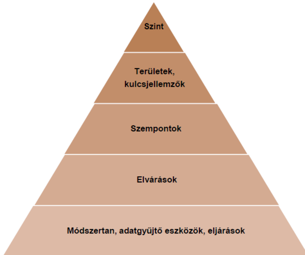
2. sz. ábra. Az önértékelési standard szerkezete